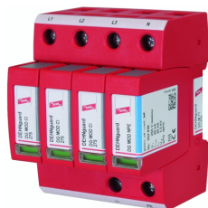
Illustrations sans engagement