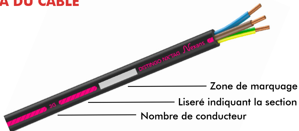
SCHÉMA DU CÂBLE