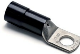
TABLEAU DES CONDUCTEURS IEC 60228: 2004-11

L'outillage spécifique à ces cosses est seul habilité à garantir la qualité de la connexion, tant sur le plan électrique que mécanique. Température d'utilisation: de -20°C à +115°C (continue) (en pointes +130°C).