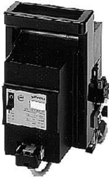
Figure à titre d'exemple

SENTRON, fusible-interrupteur-sectionneur 3NP5, 3 pôles, NH00, 160 A, avec adaptateur pour Système de jeu de barres 8US 40mm avec enclenchement brusque, étrier de serrage, surveillance de fusible : l'intégration 3VU, Interrupteur auxiliaire sur interrupteur-sectionneur : 1 NO +1 NF Interrupteur auxiliaire sur surveillance de fusible : 2 contacts à fermeture