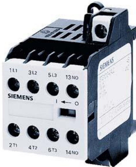
Figure à titre d'exemple

Relais de puissance, AC-3 8,4A, 4kW / 400V 4NF, 24V CC 3 pôles, borne à vis